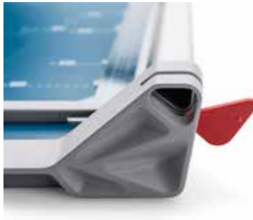
Dahle Rollenschneider 508 (Generation 3) - einfacher Messerkopf-Tausch mit unverlierbarer Verriegelung