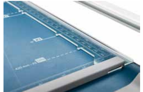
Dahle Rollenschneider 508 (Generation 3) - nützliche Formatlinien und die Pressschiene mit Markierungshilfen erleichtern das Ausrichten des Schnittgutes