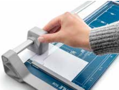
Dahle Rollenschneider 508 (Generation 3) - kinderleichte Bedienung mit zwei Fingern durch verbesserte Messerkopf-Ergonomie